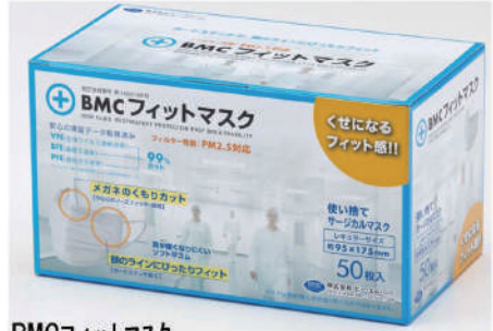
BMCフィットマスク レギュラー 50枚入り