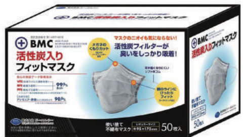
BMC活性炭入りフィットマスク 50枚入り