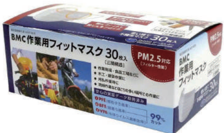
BMC作業用フィットマスク レギュラー 30枚入り