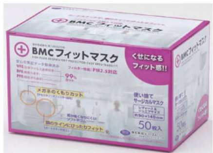
BMCフィットマスク レディース 50枚入り