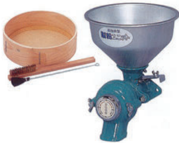
(ハイパワー強力型) 400Wモートル内蔵