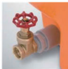
バルブ取付例(ドレン)